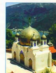
LA MOSQUÉE DE L'IMAM MAHDI

« Le Monde appartient à ceux qui luttent pour leur perfection et pour la transformation positive des mentalités collectives. »