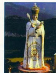
LE MESSIE COSMO PLANÉTAIRE (33m)