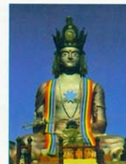
L'ADI BUDDHA MAITREYA (22m)