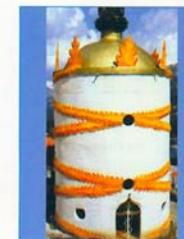
LE TEMPLE DE KALKI