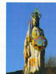
LE CHRIST COSMIQUE (21m)